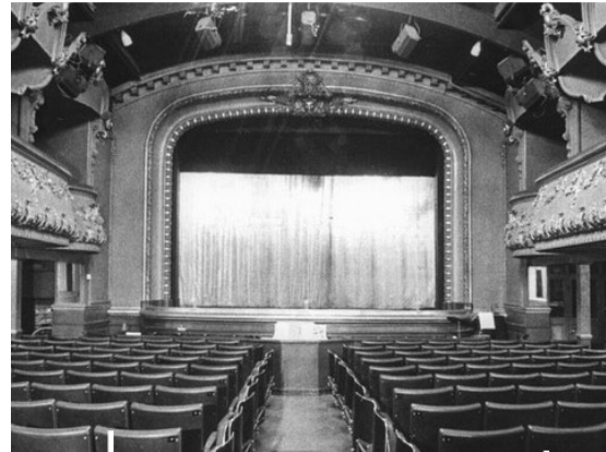
Ambiance avant le lever de rideau Casino Théâtre Genève 1976