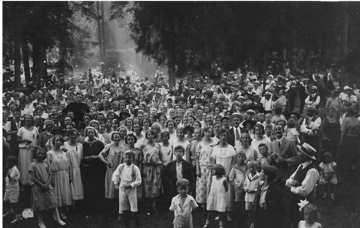
Fête socialiste aux Gollières (NE), 13 juillet 1924 (S. Thurnherr)