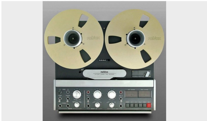
Genève plage le cours de culture physique 1987